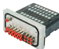
Ventilinsel für den Spritzbereich in der Lebensmittelindustrie, Reihe HDM, von 4 bis 16 Ansteuerungen

Round stainless steel cylinders, diameters from 32 to 63 mm