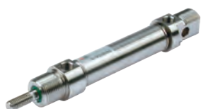
ISO 6432 Edelstahl Zylinder, Durchmesser von 16 bis 25 mm

ISO 6432 stainless steel cylinders, diameters from 16 to 25 mm