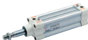
ISO 15552 Zylinder Reihe HCR, mit hoher Korrosionsbeständigkeit, Durchmesser von 32 bis 125 mm

ISO 6432 stainless steel cylinders, diameters from 16 to 25 mm